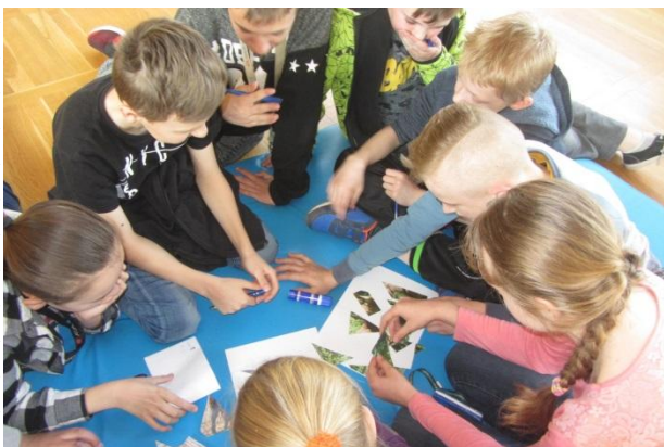
Zespoły klasowe układają puzzle.